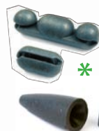
Compuesto de tungsteno